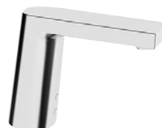
Electra berøringsfri med Bluetooth og temperaturgreb