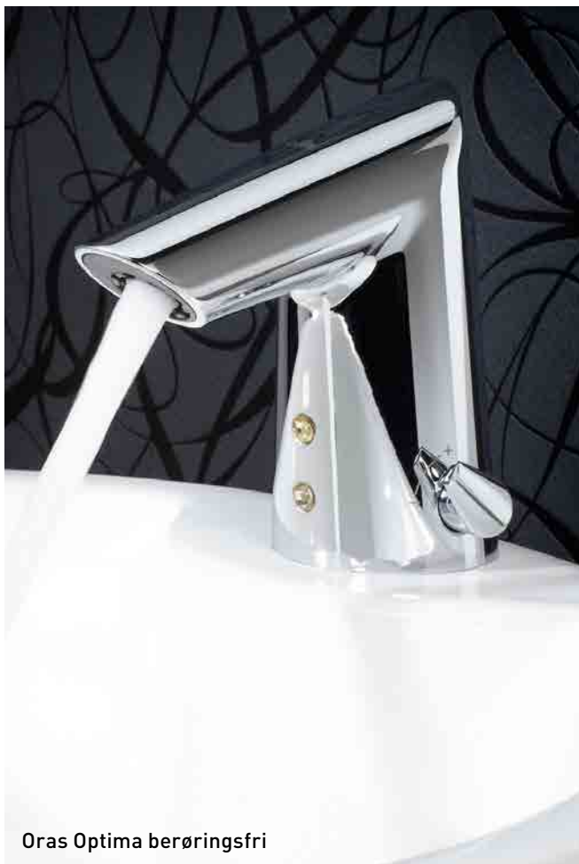
Oras Optima berøringsfri