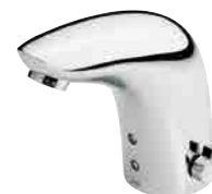
Electra berøringsfri med Bluetooth