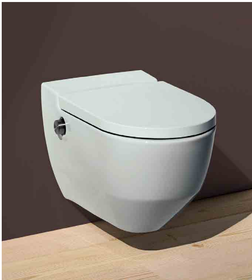
Laufen Navia duschtoilet Cleanet rimless med LCC

LCC er en innovativ overfladebehandling, der takket være en ruhedsværdi på 4 nanometer sikrer at LCC behandlede overflader er op til fire gange så glatte som almindelige porcelæns-overflader - kalk og bakterier rengøres nemt.